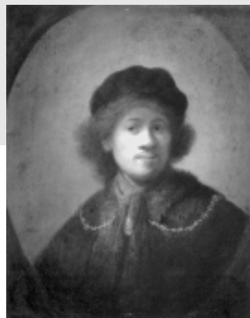
Автопортрет, 1630 г.

В писмо до брат си Тео през октомври 1885 г. Винсент ван Гог казва: „Рембранд е така дълбоко мистериозен, че казва неща, за които няма думи в никой език. Правилно е наречен чародей, ... а това прозвище не се дава лесно.“