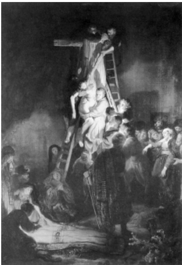
Свалянето на Христос от кръста, 1634 г., масло, 158 x 117 см, Ермитаж