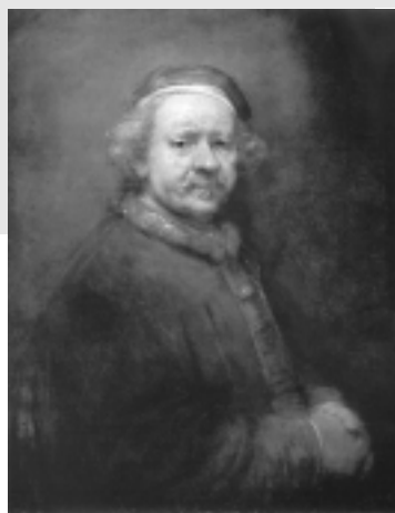
Автопортрет, 1669 г.